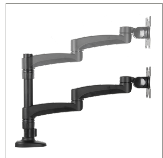
Werkzeuglose Höheneinstellung durch Feststerring