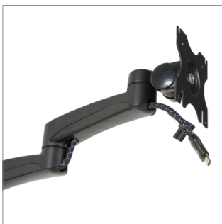
Integriertes Kabelmanagement für eine klare und aufgeräumte Installation