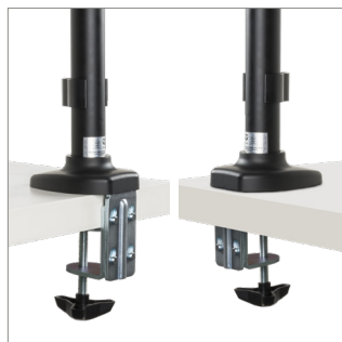
Ausgestattet mit einer Tischklemme zur Befestigung an der Seite oder Rückseite des Schreibtisches und einer Durchführungs Vorrichtung