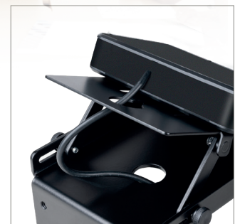
Gestion intégrée des câbles