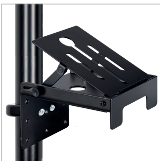
Peut être fixée sur des tubes à l'aide de colliers accessoires de B-Tech