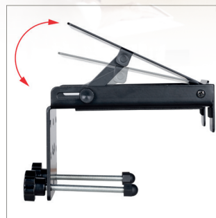
L'étagère peut être positionnée à plat ou inclinée vers le bas jusqu'à +25°