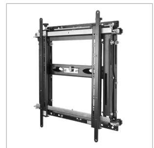
Optional Interface Adapter für VESA 600 x 400 Befestigungen serienmäßig enthalten