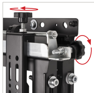
Werkzeuglose Feinjustage an 8 Punkten für eine nahtlose Display Ausrichtung