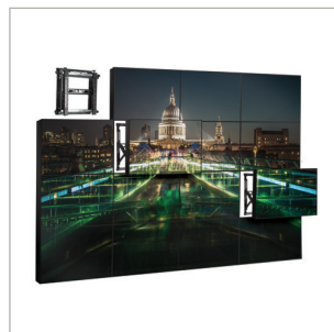
Modulare Halterung ermöglicht eine Videowand Zusammenstellung in unbegrenzten Gestaltungsmöglichkeiten

*Bitte beachten Sie beim Verwenden der beigegefügt Interface Adapter Arme um VESA 600 x 400 zu montieren, erhöht sich die Gesamttiefe der Bildschirme um 6mm. Gesamttiefe von 107mm, oder 299mm popped-out (+/- 7mm Fein-Justage)