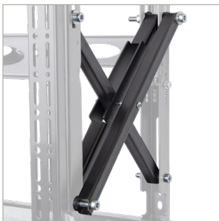
Thanh nối hai bên được gia cố để chịu được tải trọng lên đến 125kg