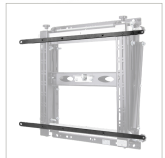
Bao gồm bộ điều hợp giao diện tùy chọn cho các bản sửa lỗi VESA 600 x 400 theo tiêu chuẩn