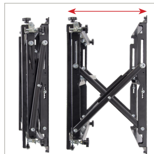
Hệ thống đẩy để mở / đẩy để đóng giúp truy cập dịch vụ nhanh chóng và dễ dàng