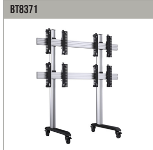
BT8371 Universele mobiele videowandstand voor videowanden