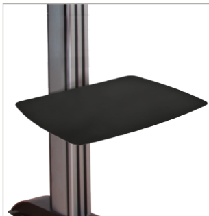
Compatibel met System 2-accessoires zoals schappen, zonder dat er paalringen aan te pas moeten komen