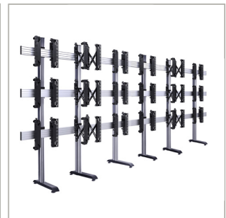
Ga naar onze online configuratie-tool om de opstelling, het aantal schermen, de oriëntatie en hoogte te bepalen