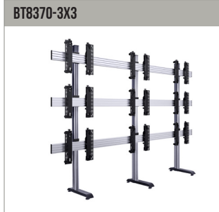
BT8370-3X3 Universele videowandstand voor 3x3-videowanden