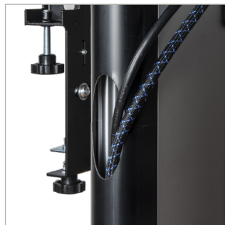
Kabelbeheer verbergt kabels voor een nette afgewerkte installatie