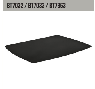
BT7032 / BT7033 / BT7863 AV-accessoireschappen kunnen direct aan de verticale kolom bevestigd worden