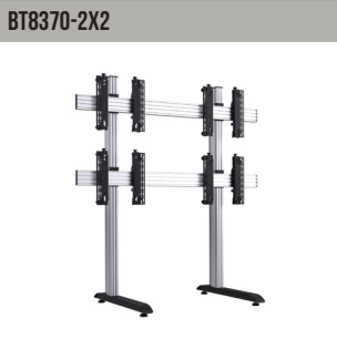
BT8370-2X2 Universele videowandstand voor 2x2-videowanden