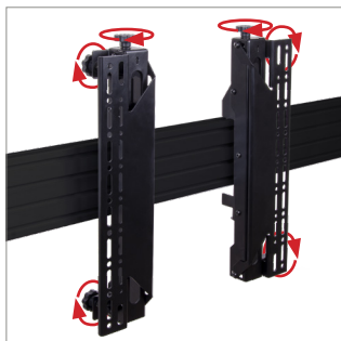
Gereedschapsloze fijnafstelling zorgt voor een naadloze uitlijning van schermen