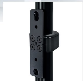
Idealnie pasuje z opaską BT7051 do zamontowania szyny BT8390 na wysięgniku (Ø50mm)