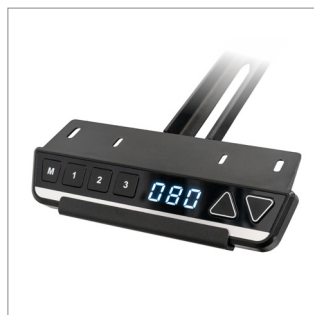
Bao gồm một bảng điều khiển có dây