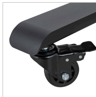
Bao gồm bộ bánh xe khóa/phanh 3" không gây xước sàn