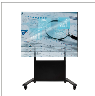
Phạm vi điều chỉnh độ cao lên đến 650mm