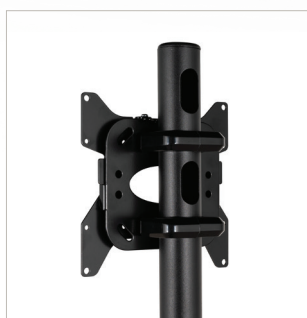
Système intégré pour organiser les câbles