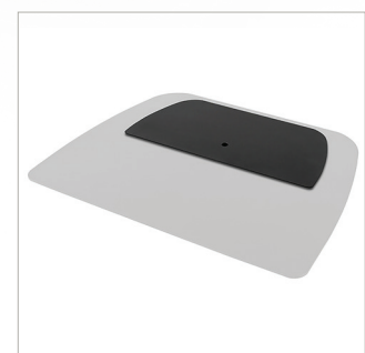
Comprend une plaque de recouvrement pour cacher les poignées après l'installation