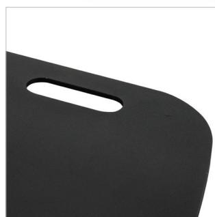
Les poignées permettent une manipulation facile