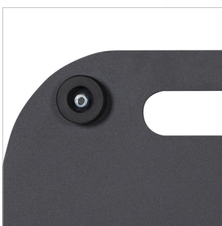
Fourni avec des pieds en caoutchouc non marquants pour une meilleure stabilité