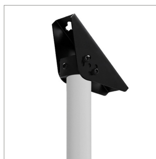
天花板固定架可安装在倾斜度最大至90°的天花板上