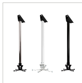
黑色、白色或者镀铬可选