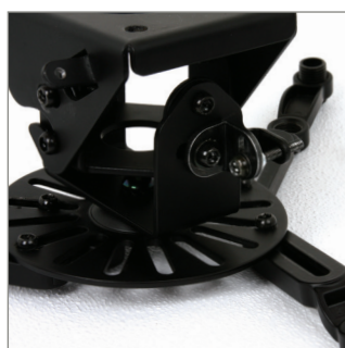
可选的微调功能可用于短焦投影仪