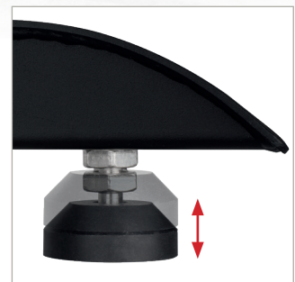
Verstellbare Nivellierfüße zum Ausgleich von Bodenunebenheiten