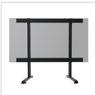
Speziell entwickelt und konfiguriert für die Samsung 110" IAB All-In-One Serien