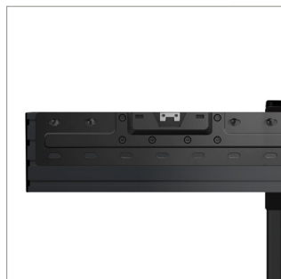
Mitgelieferte Halterungen zur sicheren Befestigung an BT8390-Schienen